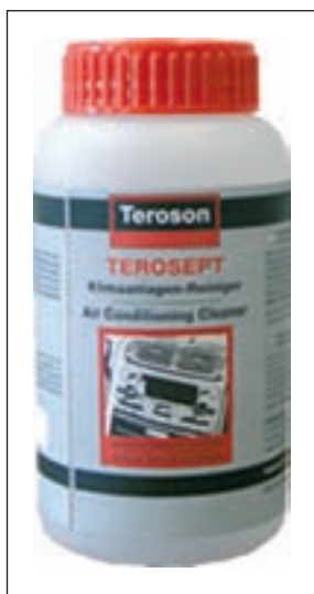
200-миллиметровый флакон антисептика-очистителя Terossept — специальная упаковка для современного ультразвукового оборудования, поставляемого ООО «Русхенк».

Просим обратить внимание — описанные действия не являются инструкцией по эксплуатации. Они лишь показывают, что ничего сложного в очистке кондиционера «Теросептом» нет.