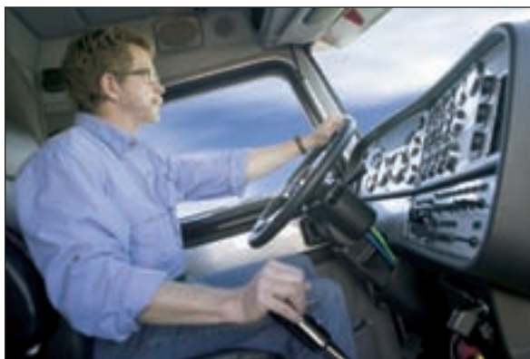
Регулярная очистка автокондиционера особенно актуальна для водителей-профессионалов.

Медики считают, что появление Legionella в автомобильной системе кондиционирования маловероятно. Но ведь грибков, бактерий,